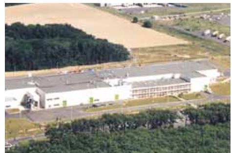
Cargill Foods france