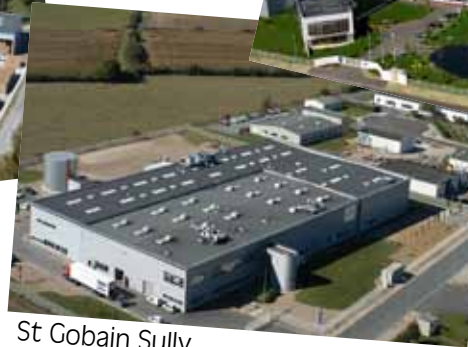
St Gobain Sully