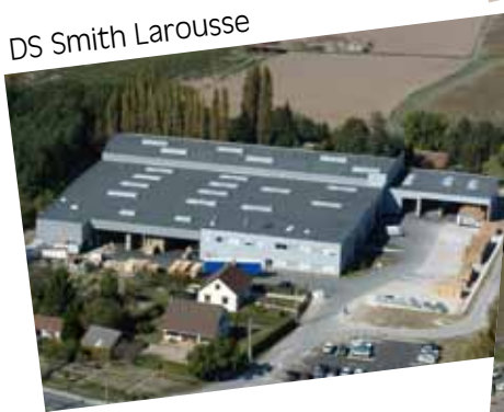
DS Smith Larousse