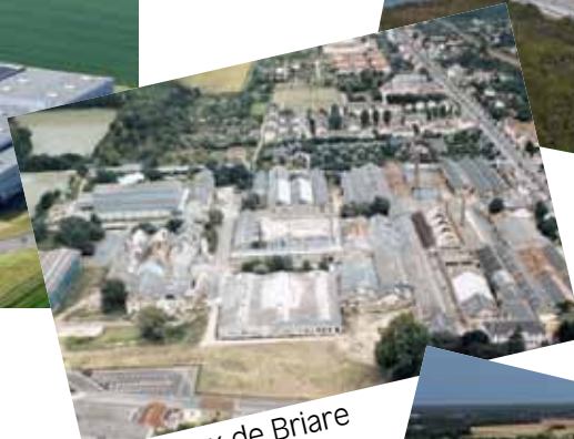
Émaux de Briare